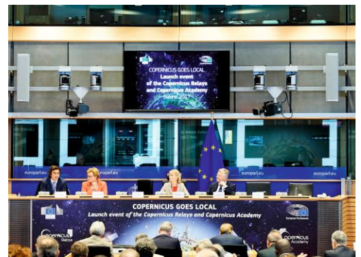
The official launch ceremony of the Copernicus Relay and Copernicus Academy Copernicus Goes Local – Implementing the Space Strategy for Europe