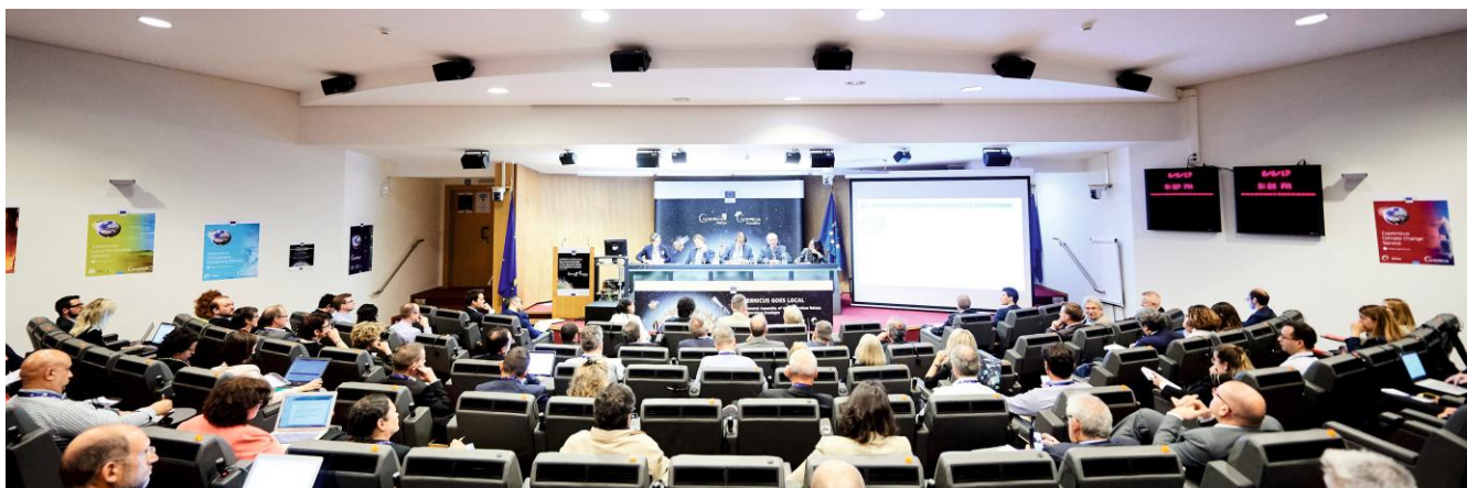
1. godišnja skupština Copernicus Relay i Copernicus Academy